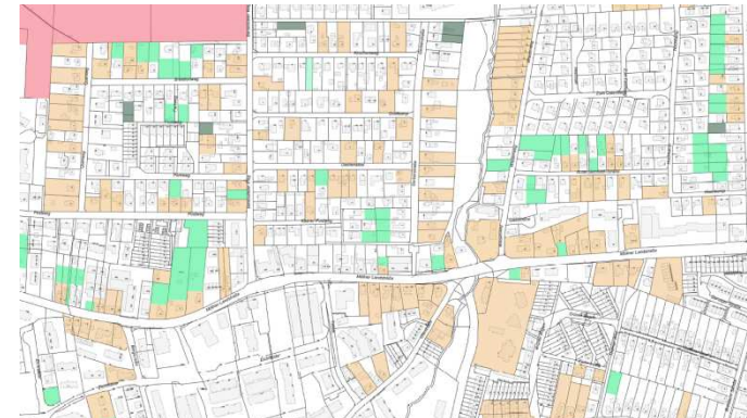
Abb.: Lageplan des Potenzialflächenkatasters

Den Lageplan der Potenzialflächen können Sie im Rathaus (Möllner Landstraße 20, 22113 Oststeinbek) vor Raum 06 (EG) zu den Öffnungszeiten einsehen. Ebenfalls ist dieser auf der Homepage der Gemeinde Oststeinbek abrufbar unter: http://www.oststeinbek.de/rathauservice/planen-bauen-umwelt/potenzialflaechenkataster.html .