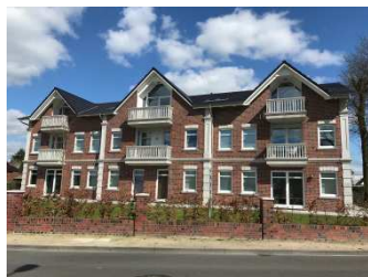
Abb.: Von der Baulücke zur qualitativen Innenentwicklung