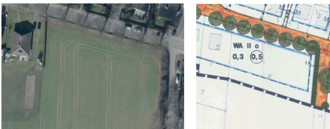
Abb.: Baulücke und der gültige Bebauungsplan

Unter den Baulücken sind keine gemeindeeigenen Flächen. Es handelt sich um private Grundstücke. Daher hat die Gemeinde auch keinen Einfluss z.B. auf einen Verkauf. Unbekannt ist, ob seitens der Grundstückseigentümer ein Entwicklungs- oder Veräußerungsinteresse besteht. Personenbezogene Daten jeder Art (z.B. Eigentümerkontaktdaten) sind aus datenschutzrechtlichen Gründen nicht Bestandteil des Katasters.