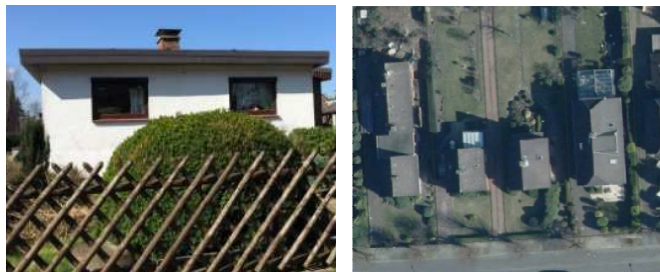
Abb.: Untergenutzte Grundstücke

Auch Grundstücke, auf denen die mögliche überbaubare Fläche offensichtlich nicht voll ausgenutzt ist, wurden entsprechend erfasst. Hier wäre z.B. künftig ein Anbau denkbar. Ungenutzte Grundstücke werden im Lageplan orange dargestellt.