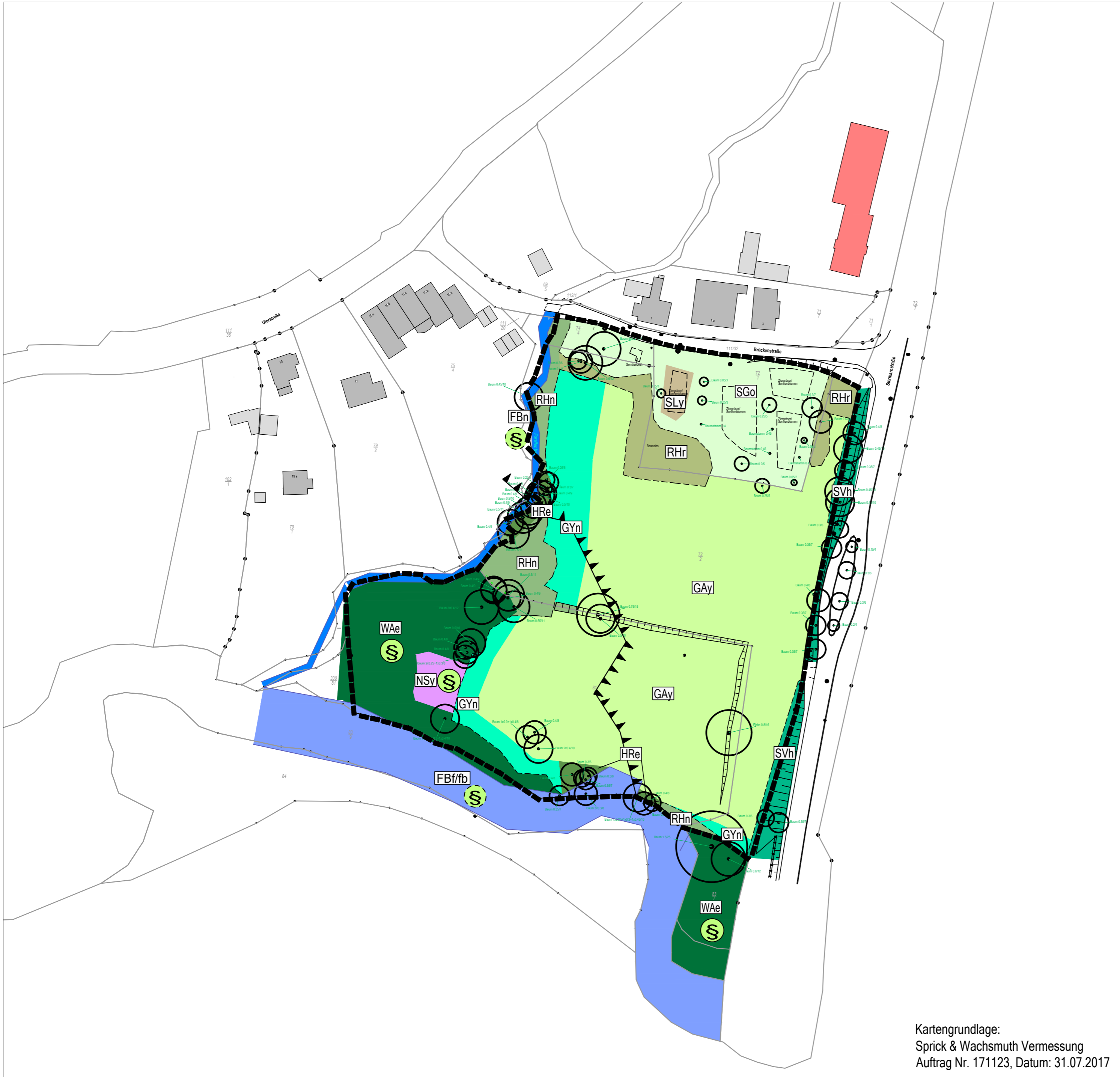
Kartengrundlage: Sprick & Wachsmuth Vermessung Auftrag Nr. 171123, Datum: 31.07.2017